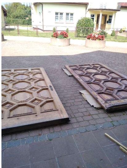
Drzwi wejściowe do kościoła przed renowacją.