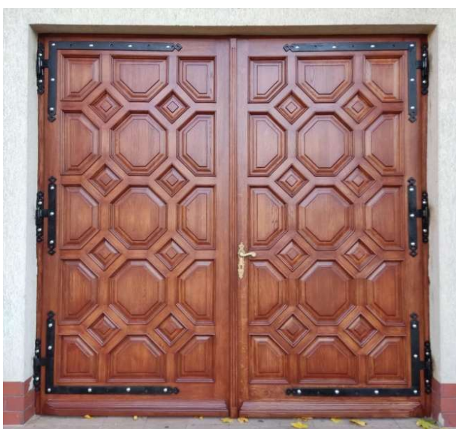
Całość prac zaproponował i wykonał parafianin – Zbigniew Biernath.