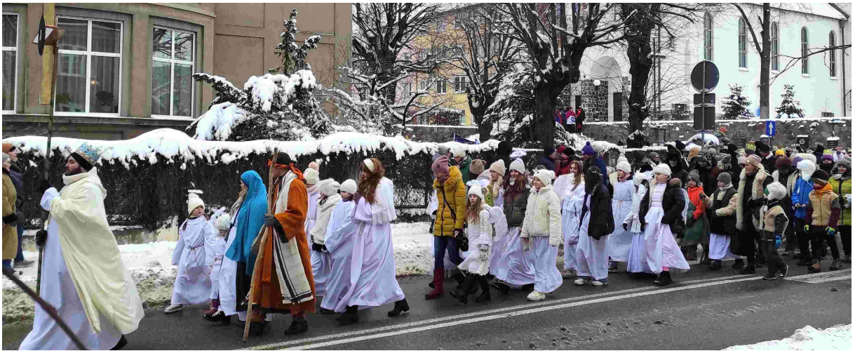
W 2014 roku Orszak Trzech Króli wyruszył z Sanktuarium Św. Brunona i przeszedł głównymi ulicami miasta do parafii Ducha Świętego Pocieszyciela.