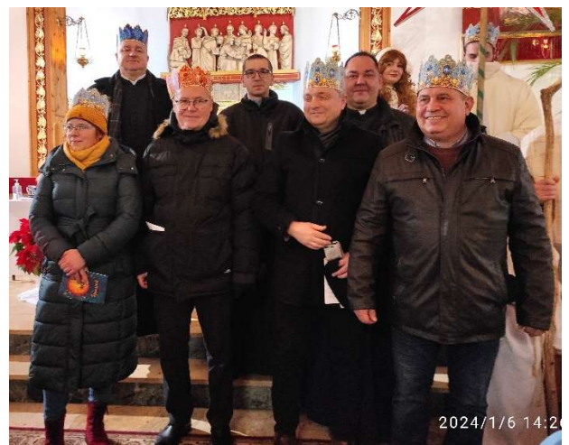
W Orszaku wzięli udział mieszkańcy Giżycka, Księża posługujący w parafiach oraz władze miasta i powiatu.